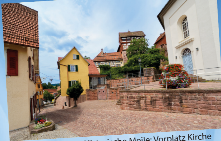
Historische Meile: Vorplatz Kirche