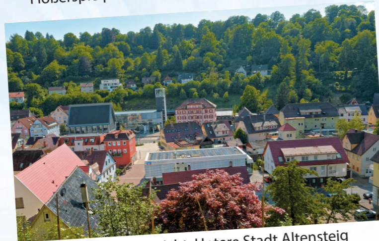
Aussicht: Untere Stadt Altensteig