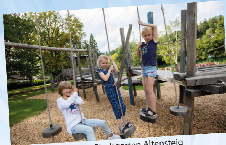
Flößerspielplatz: Stadtgarten Altensteig